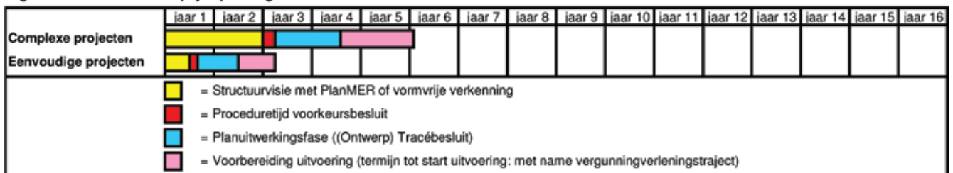
Figuur 2: voorziene doorlooptijd oplossingen

In dit hoofdstuk presenteert de commissie een drastische aanpassing van het besluitvormingsproces. De commissie heeft in beeld laten brengen wat haar voorstel kan opleveren in termen van doorlooptijd (zie figuur 2). Op basis daarvan komt de commissie tot de conclusie dat indien het advies integraal wordt uitgevoerd een halvering van de doorlooptijd van het besluitvormingsproces mogelijk is. Dit gaat echter niet vanzelf 5 en zal dan ook een doelstelling moeten zijn van de overheid. De grootste winst wordt bereikt door een gedegener verkenningfase die wordt afgesloten met een politiek gedragen voorkeursbesluit. Daardoor kan de huidige instabiele planstudiefase vervangen worden door een veel kortere 'planuitwerkingsfase' gericht op het uitwerken van het voorkeursalternatief, waarna het tracébesluit snel wordt genomen. Hierna wordt per fase het aangepaste besluitvormingsproces beschreven.